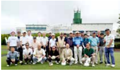
令和6年 ゴルフコンペ

参加申込は大洞院寺務所で受け付けています。コンペ詳細についても気軽に問合せください。