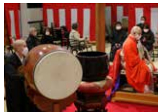
本堂での除夜祈祷

お正月は特別に金剛鈴と太鼓で厄除け祈祷を行います。どなたでも参加頂けます。本堂にお入りください。