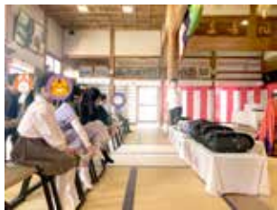
令和6年 ランドセル祝祷

当日は、子どもたちのランド セルをお釈迦様の前に並べて祈 禱します。檀家以外も参加いた だけます。