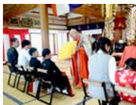
令和6年11月 七五三祈願

成長する子供の将来を想い、健康を祈願します。本堂で開催する七五三祈願の参加者には千歳飴と絵馬をお授けします。家族揃って写真を撮る際は、大洞院のスタッフがお手伝いします。