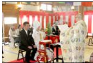
本堂での仏前結婚式