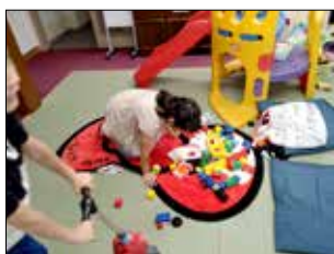
遊具や絵本を多数用意しています