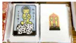
御朱印帳（大野隆司デザイン） ¥1,000

自分の守り本尊の御朱印や、季節に合わせたデザインを選ぶことで自分らしい御朱印とご縁を結びましょう。