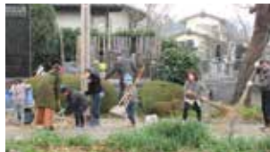
子ども達が落ち葉掃き