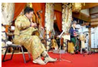
10月13日 秋の寺コン 「馬頭琴コンサート」