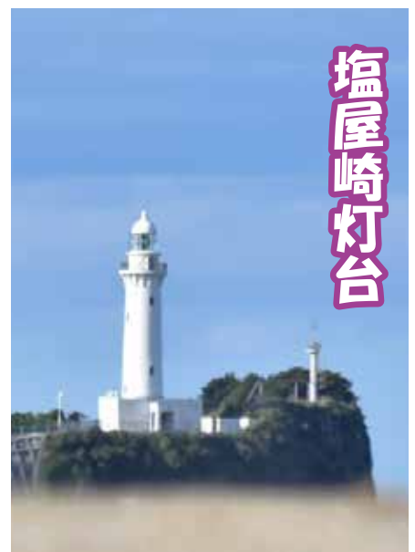
昭和の歌姫 美空ひばりの歌碑