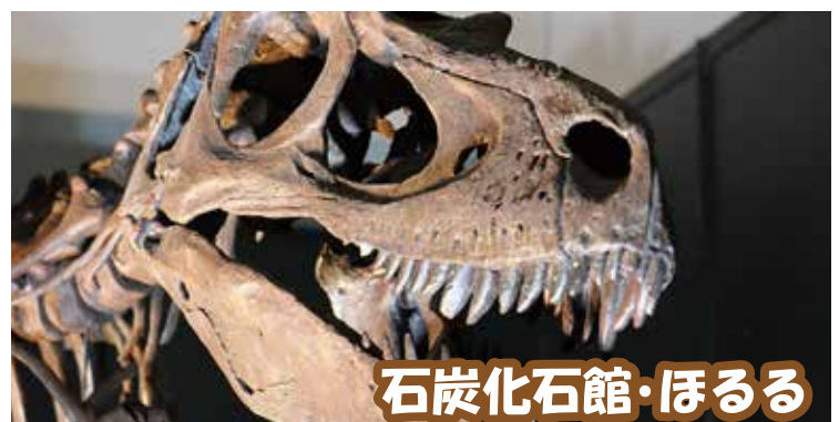
日本有数の化石発見の地・いわき市の誇る博物館