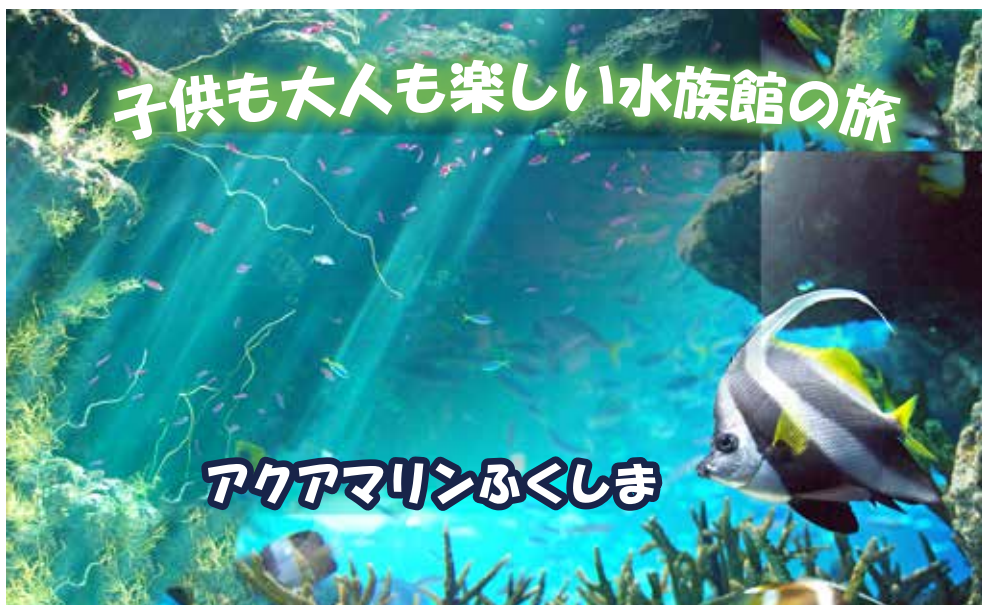
さまざまな海の生き物に会える「アクアマリンふくしま」