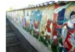
境内墓地壁画「遊戯」 作 長縄えい子

春と秋に定期的に行う本堂コンサートです コンサート等の情報は 大洞院ホームページにて 随時案内しています