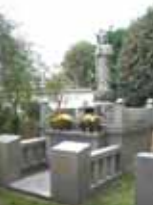
ペット供養墓「やすらぎの碑」

ちいさな家族が眠っているペット供養墓です 毎年、春・秋彼岸ペット合同法要を執り行います 塔婆供養もできます