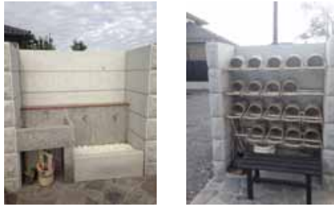
水場には掃除用具並びに手桶・柄杓があります