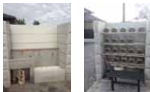
水場には掃除用具並びに手桶・柄杓があります