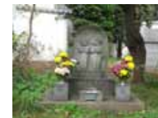
いぬねこちぞう 原作 大野 隆司