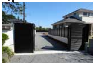
周囲をフェンスに囲まれた静かな空気の流れる境内墓地です