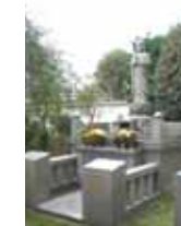
ペット供養墓 「やすらぎの碑」